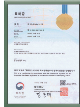
살균필터 및 살균정지 특허증

필터 세척 및 재사용이 가능하며, 반영구적 사용으로 ESG 경영에 부합.